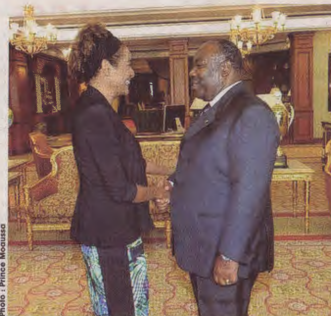
La SG de l'OIF et le chef de l'Etat, Ali Bongo, lors d'une visite au Gabon.