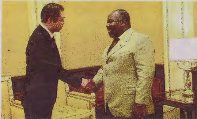
Poignée de main entre le chef de l'Etat et le nouvel ambassadeur de Chine au Gabon.