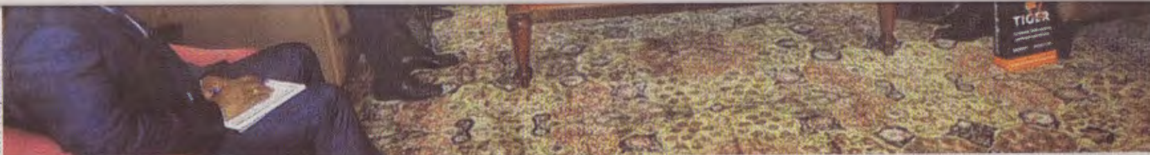
Ali Bongo Ondimba échangeant avec des hommes d'affaires marocains.