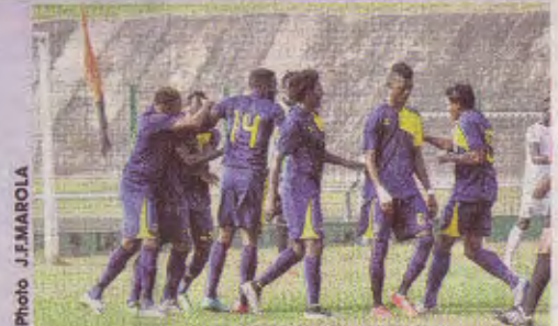
Les joueurs d'Akanda FC.