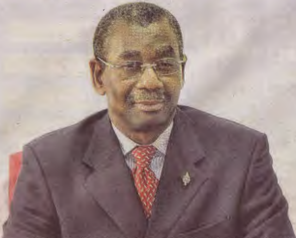
Martin Moulengui-Mabendé, l'ancien député du deuxième siège de la Boumi-Louetsi (Mbigou).