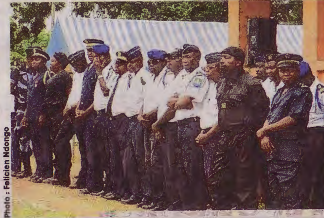
... attentifs aux différentes interventions