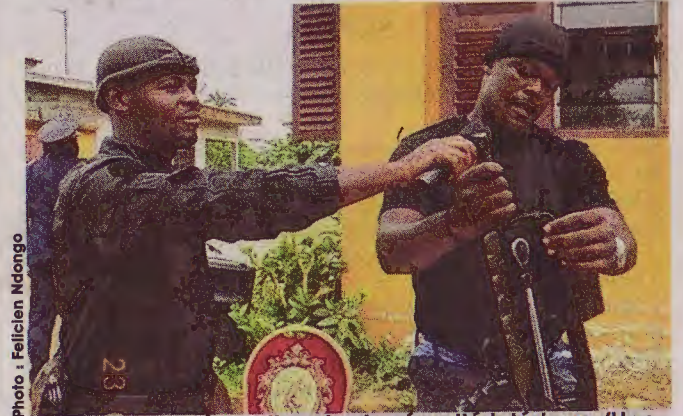
Mouila/Journée nationale de sécurité intérieure/Une phase de démonstration des éléments de la police judiciaire