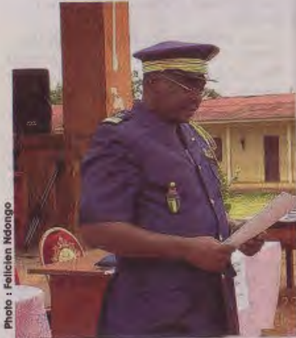
Mouila/Journée nationale de sécurité intérieure/Col. Alain Mamiaghe, directeur régional de la police urbaine