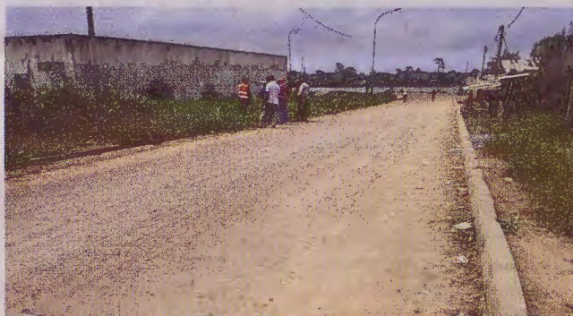
Une voie secondaire au quartier Lalala, à Lambaréné, sur le point d'être goudronnée par la société Mika-services.