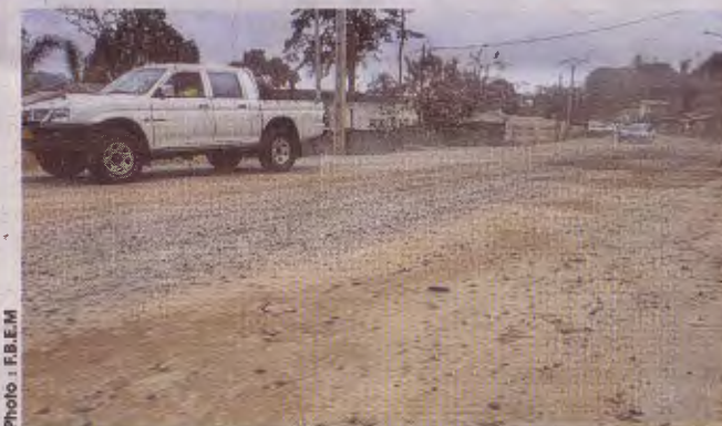
La route nationale traversant la ville de Lambaréné va également être réhabilitée.