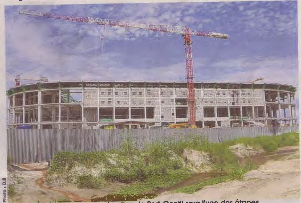
On saura si le stade d'Oyem est en passe de ressembler à la structure de sa maquette