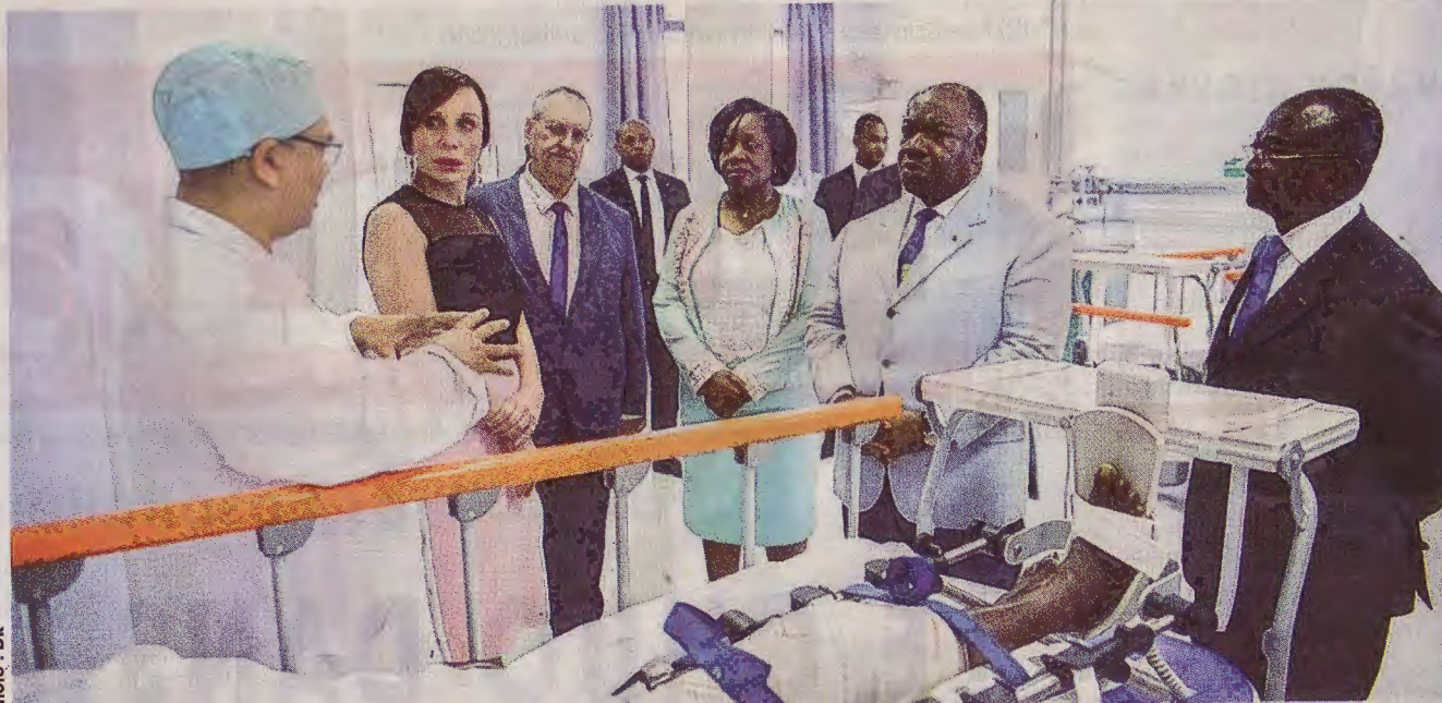
Une phase de la visite du président de la République dans les locaux du CHUO.

Initialement conçu comme Centre national de référence de traumatologie et d'orthopédie, cet hôpital a vu ses missions être élargies aux fins de mieux répondre aux besoins sanitaires des populations gabonaises. La structure