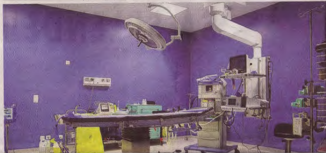
Vue d'un plateau technique.

fait de cette œuvre qui, selon lui, témoigne des efforts entrepris par le gouvernement dans ce secteur qui demeure une priorité. D'ailleurs, « petit-à-petit, nous avançons dans cette quête qui est pour nous, "la santé réellement pour tous" », a-t-il rassuré. Non sans rappeler que des efforts doivent se poursuivre dans ce secteur. Surtout en matière de formation où des spécialistes devraient être la cheville ouvrière de ce bel ouvrage qui vient enrichir le système sanitaire gabonais.